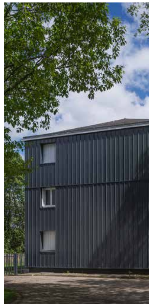
↑ Réhabilitation énergétique d'ampleur à Donges

Les représentants des associations de locataires sont associés aux projets d'Habitat 44. Nous échangeons régulièrement. Un objectif commun : être au service des locataires pour garantir un cadre de vie de qualité.