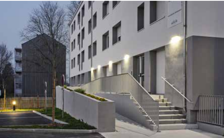
↑ Résidence Habitat Jeunes de Blain