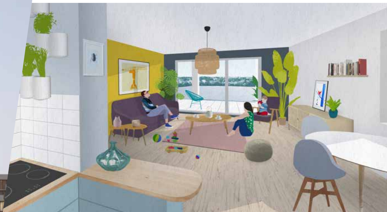
Perspective non contractuelle, exemple d'aménagement

Orientés Sud et Ouest, les logements offrent des vues imprenables, sans vis-à-vis, sur la Loire. Destinés aux familles (du type 3 au type 5), les appartements s'apparentent à des maisons de ville avec pour particularité d'être organisés sur 1, 2, voire 3 niveaux. Chacun dispose d'un accès indépendant et d'une partie privative extérieure : grand balcon, loggia ou même terrasse. Habitat 44 propose également des parkings à louer.