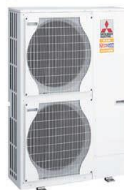
CTXS-K / FTXS-K